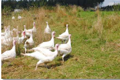
Die Puten werden auf dem Bioland-Betrieb von Heiko Müller gehalten.