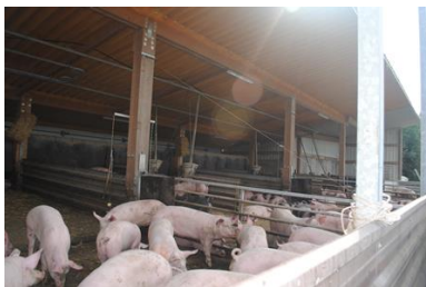
Schweine im Offenstall auf dem Schweinemast-Betrieb von Dominik Greim